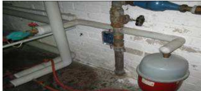
Trinkwasserinstallation in einem Wohngebäude