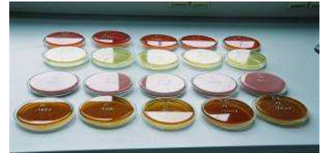
Nährbodenplatten, Labor